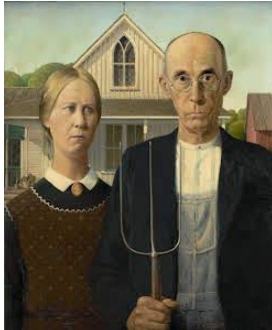
Resim 2. Amerikan Gotiği, Tuval Üzerine Yağlıboya ,74x62 cm (Grand Wood,1930).

Grand Wood ve Andrew gibi “bölgeseleler” Amerikan yaşamını Avrupa yaşamından farklı olduğunu ve Amerikan sanatının, Amerika’yı yansıtan sahnelerle ancak resimlerle tanıtılabileceğini savunmuşlardır. Nitekim “Grand Wood, Amerikan Gotiği” adlı tablosu bu görüşe atıfta bulunmuştur (Resim 2).