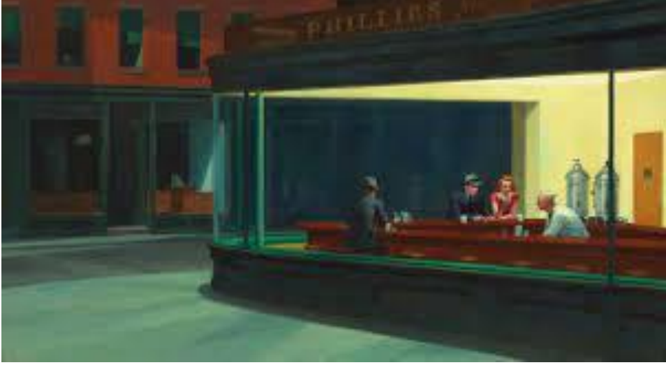
Resim 1. Gece Kuşları, Tuval Üzerine Yağlıboya, 84x152cm (Edward Hopper, 1942).

Sanatçının, o dönemin Amerikan yaşamından bir kesit sunan en bilinen eserlerinden biri "Gece Kuşları" adlı tablosudur (Resim 1).